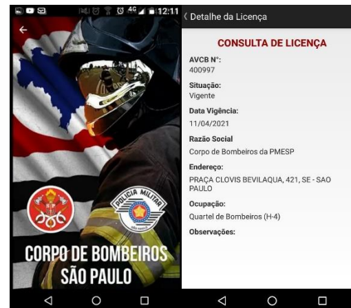
Aplicativo Bombeiros SP

Consulta Ordem Fiscalização emitida pelo Corpo de Bombeiros.