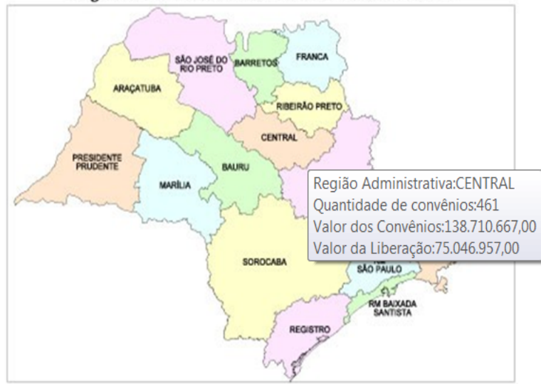
Regiões Administrativas do Estado de São Paulo